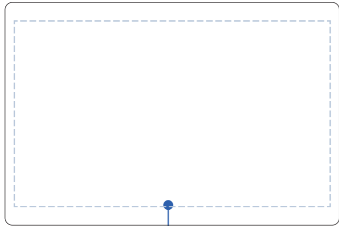
名入れ可能範囲 (この範囲内にロゴを配置してください。)